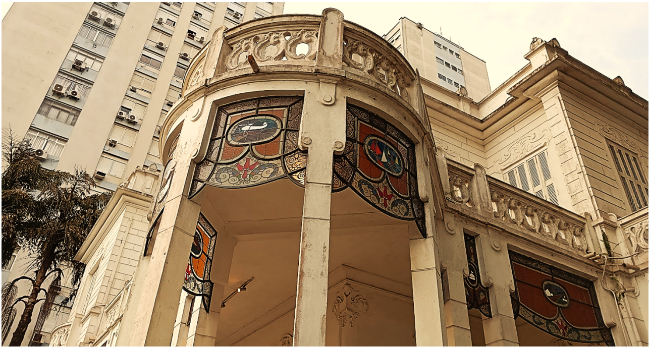
Ilustración 1. El caserón de la pinacoteca Benedito Calixto

El evento consistió en presentaciones académicas organizadas en tres áreas temáticas: Paisajes sonoros en la producción audiovisual contemporánea, La sociedad del cansancio: manifestaciones y praxis y Productividad, adrenalina y endorfina. Estas temáticas lograron abarcar la gran diversidad de ponencias presentadas. El evento también contó con la participación de números musicales y conferencias magistrales, tanto de Brasil como del exterior: el día miércoles 17 se presentó la británica Stephanie Dennison y el día viernes 19, el realizador audiovisual paulista Rogério Ferraraz.