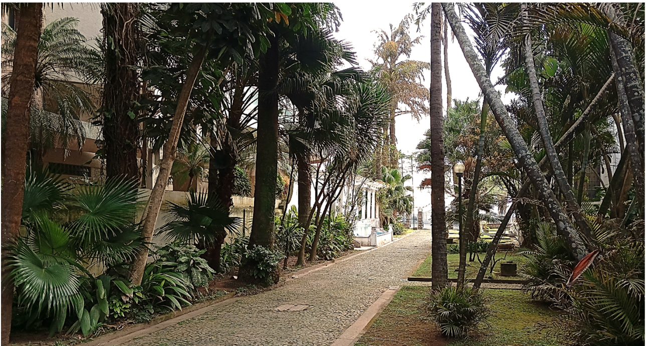
Ilustración 2: El camino que llevaba hacia el Auditorio y su diversa vegetación.

Más tarde se realizó la exposición de libros de participantes del encuentro, y, para finalizar la jornada, asistimos a una deliciosa y virtuosa presentación de la Escola do Choro e Cidadania Luizinho 7 Cordas , en el Clube do Choro de Santos .